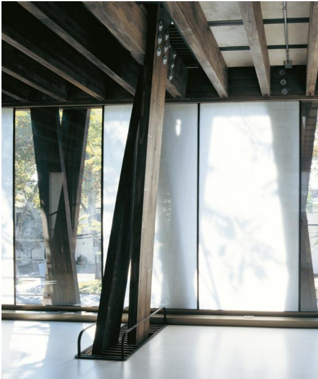
Edificio BIP Computers. Arquitecto | Alberto Mozó. Foto | Cristóbal Palma